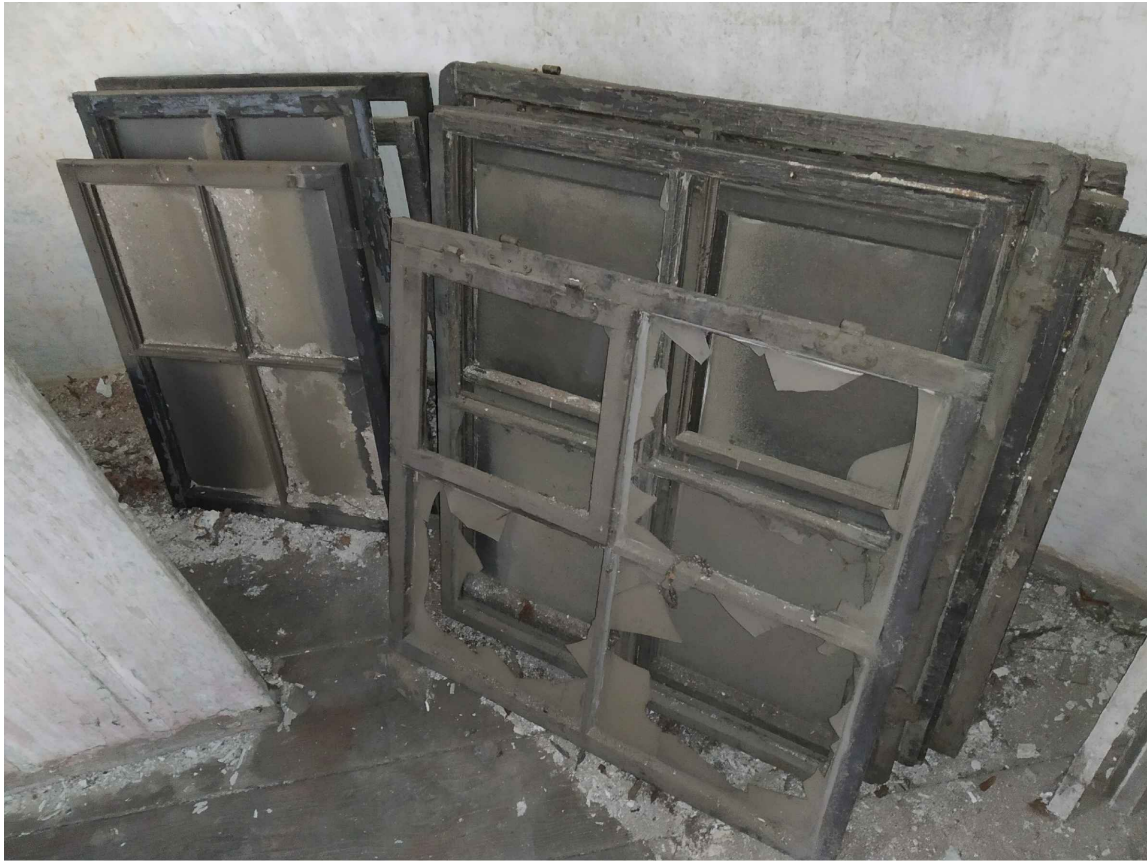
FOTO: stávající okenní křídla – Lze vidět různě profilování rámu a různé druhy kování. Proto je nutné provést výrobu repliky v odpovídajícím provedení jako jsou okna na stejném podlaží.